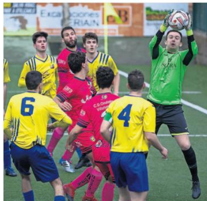
El portero del Amig6, en una intervenci6n ante el Ondalán.

La decisión de ayer de la FNF fue repentina, pero varios clubes del fútbol navarro ya han to-