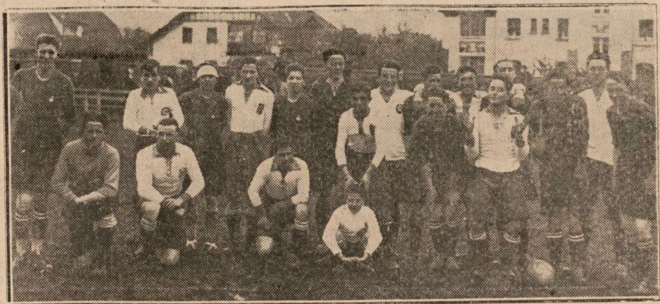
Los equipos de Aoz y de Lumberri que el domingo jugaron en San Juan un interesante partido.