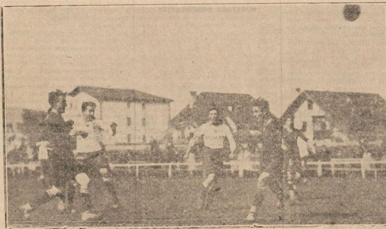
Meca, shoota a pesar de el esfuerzo de la defensa de Aoz