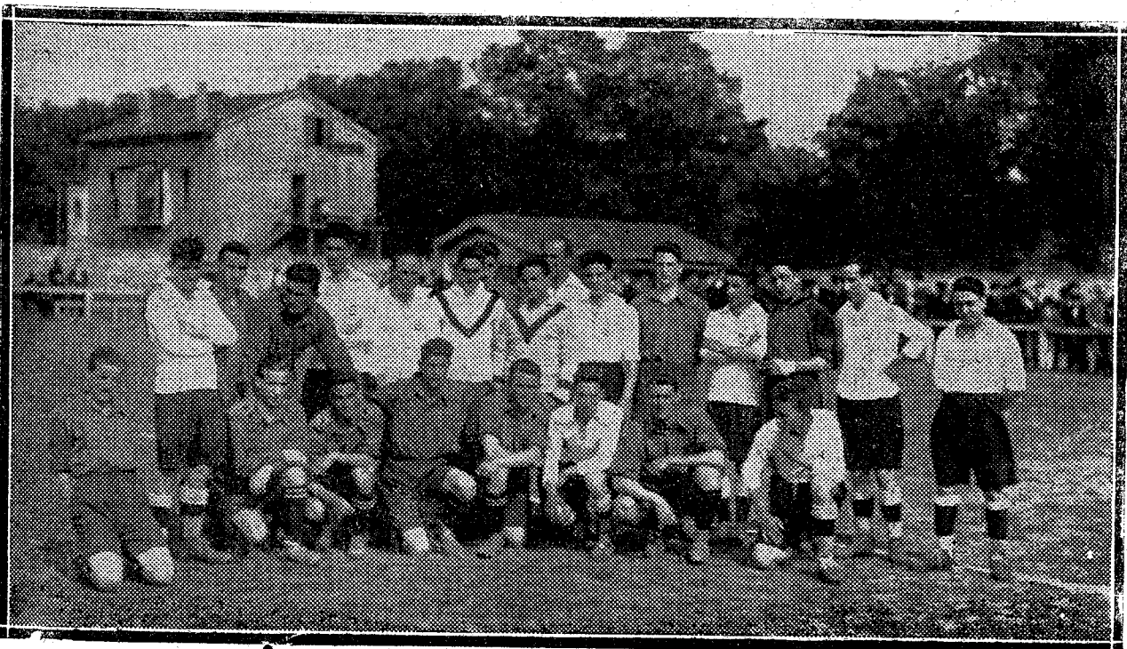
Los equipos Real Unión de Irún y Osasuna.